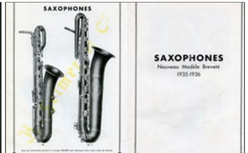
Eine SELMER Anzeige und ein Auszug aus dem Katalog von 1936