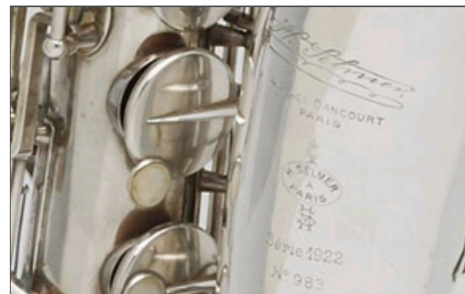
Das erste SELMER Saxophon: "Series 1922"

Am 31. Dezember 1921 wurde das erste SELMER Saxophon fertig - man nannte es "Series 22". Zu dieser Zeit hatte Selmer 50 Mitarbeiter und baute dann etwa 30 Saxophone im Monat. Noch im Jahr 1922 folgte das "Model 22", das robuster war und bereits eine automatische Oktavklappe hatte. Man fertigte nun die ganze Saxophonfamilie sowie das C-Melody, das besonders beliebt bei Jazzmusikern der 20er Jahre war.