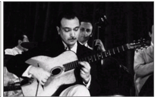
Adolphe Sax Patent aus dem Jahr 1846 und Django Reinhardt mit seiner SELMER Gitarre